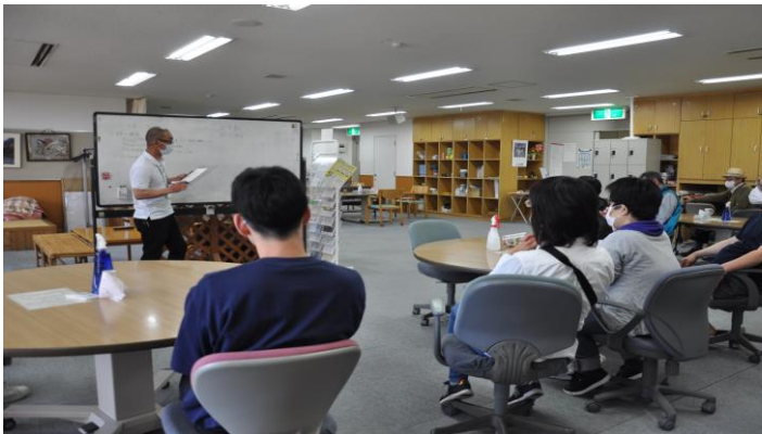
▲ 基本的なルールを再確認する利用者 りようしゃ のみなさん

— 利用者 りようしゃ と職員 しよくいん が基本的な きほんてき ルールを再確認 さいかくにん —