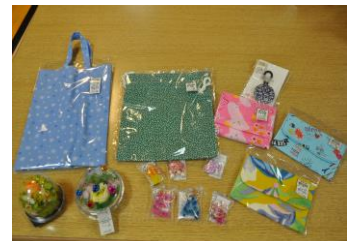
▲ かわいい小物・アクセサリや布バック