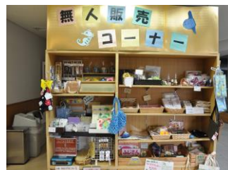
▲ 福祉会館 1F 無人販売コーナー