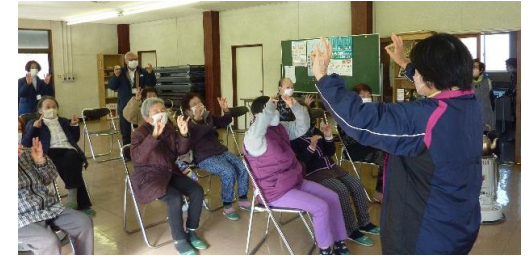
最初は、指体操から