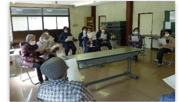
最後は、大きな声で童謡を歌いました