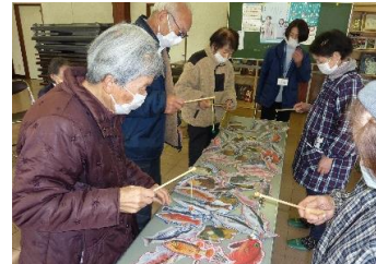
釣りゲーム。何匹釣れるかな？