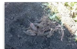
協力して掘りました ← さつま芋を傷つけないように