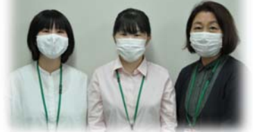
稲田・鴨狩・稲葉

新型コロナウイルス感染症が、日本で発見されたのは2020年1月16日ごろ・・・あれから1年7か月くらいが過ぎています。世界中に広がってしまい、終息の兆しも見えない状況ですね。8月20日から9月12日まで緊急事態宣言が発令されました。行動が制限され不安を感じますが、皆様お元気にお過ごしてでしょうか？