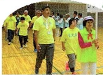
6/15 福祉スポーツ大会で は感謝状をいただきました。