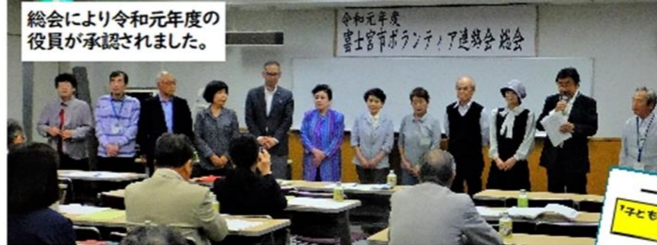
総会により令和元年度の 役員が承認されました。

5/12 富士宮市身体障害者 福祉会令和元年度定期総会 では受付や案内、弁当手配・ 片付け、ビンゴゲームなどの お手伝いをしました。