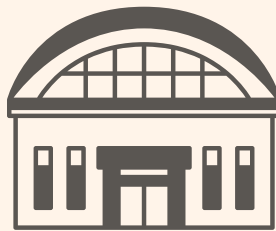
ふじのみや フードサポート