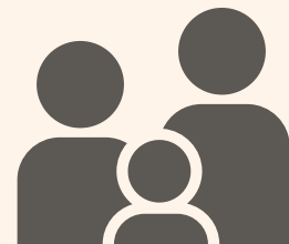
支援を必要としている 方へ届けます！

フードサポート事業は、事業の趣旨をご理解・ご協力くださった 富士宮市民の方々の善意により支えられています。