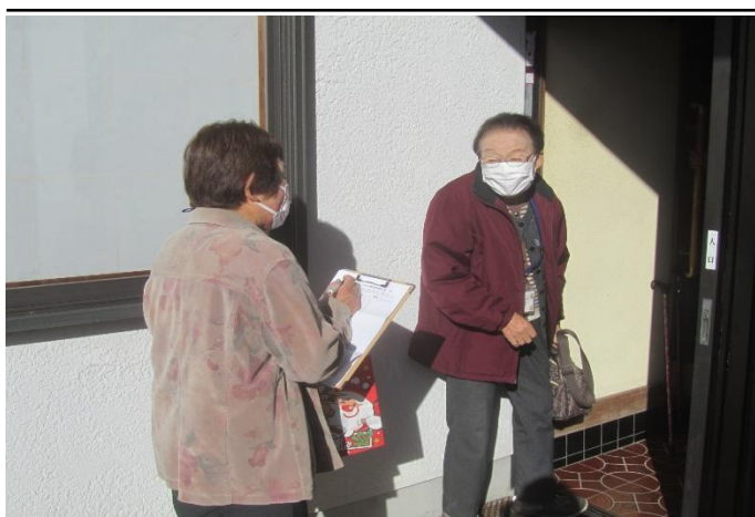
▲あったか家族スタッフによる訪問の様子

富丘地区社会福祉協議会では10年前から毎年、高齢の方や障がいを持たれている方、その他、日中なかなか外に出る機会の少ない方等を対象に、同じ地域に暮らす家族として、趣味活動や食事などを一緒に楽しむ「あったか家族のつどい」という活動を、年10回行ってきました。