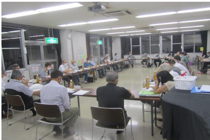
▲富士根南地区16区の見守り状況について情報共有

つながりを切らない、孤立させない、 新しいつながりを考える情報を各地区社協へ発信!!