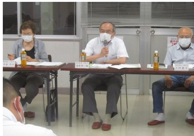
▲各区福祉委員から活動状況などを報告