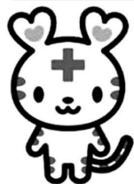
ハートちゃん 日本赤十字社 公式マスコットキャラクター

日本赤十字社静岡県支部では、県民の方々を対象に、日常のとっさの手当や予防に役立つ以下の知識を学ぶことができる各講習を地域で開催しています。