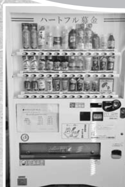
▲富士宮信用金庫様の社員食堂に設置された社会貢献型自動販売機

富士宮信用金庫様のご厚意より社員食堂に設置していただいた自動販売機で、売上の一部が共同募金に寄付され、市内の福祉活動推進のために使われるんだよ！